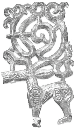
Şekil 2: M.Ö. 4. yy.a ait altın işlemeli geyik tasviri

Yine Jacobson yaratıcı, hayatın kaynağı ve soyun atası olarak kabul edilen geyiğin “Erken Göçebe” ve “İs-Kit-Sibirya” kültürünü anlamak için yegâne anahtar olduğunu ileri sürmektedir (Jacobson 1993: 46, 1-4) Sibirya kültüründe güneş, altın ve geyik birbirleri ile özdeşleştirilmiş ve kabilenin kökeni olarak kabul edilmişti (Jacobson 1993: 33).