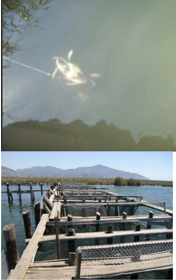
Şekil 2. Mavi Yengecin Olta ile Yakalanması ve Dalyan Kuzulukları.