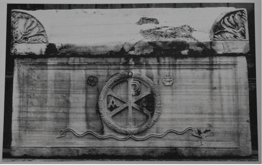
Fig. 7 İstanbul Arkeoloji Müzeleri'ndeki İsa/Constantinus Monogramlı Lahit (Koch 2000, Abb. 120)