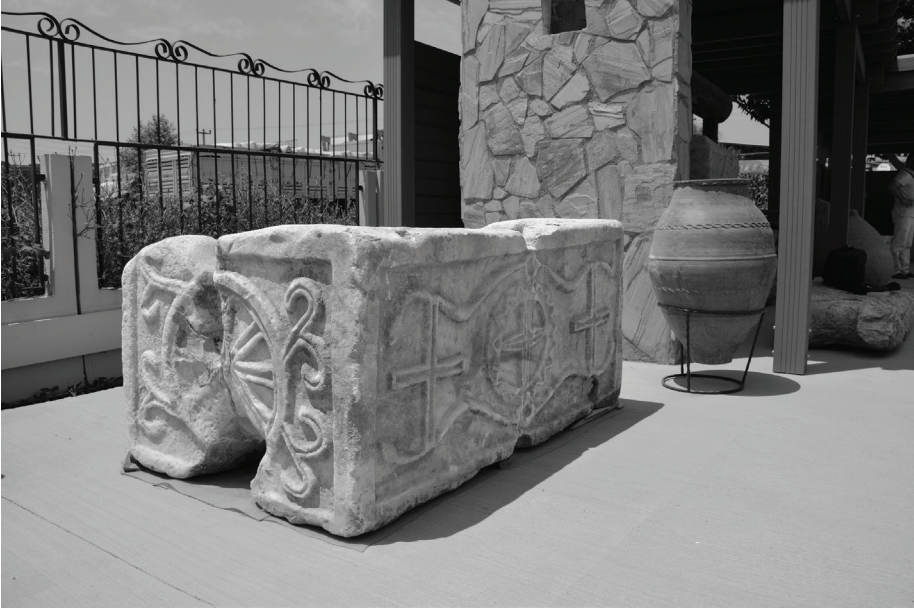
Fig. 1 Ödemiş Müzesi'ndeki lahit teknesi