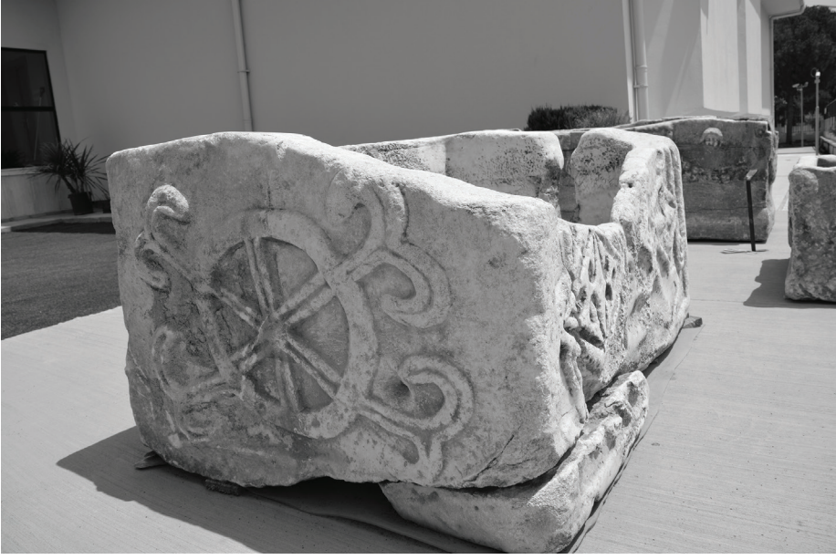
Fig. 5 Ödemiş Müzesi'ndeki lahit teknesinin sağ yüzü