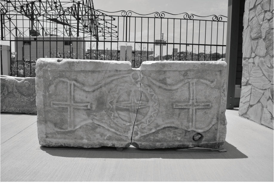
Fig. 3 Ödemiş Müzesi'ndeki lahit teknesinin ön yüzü