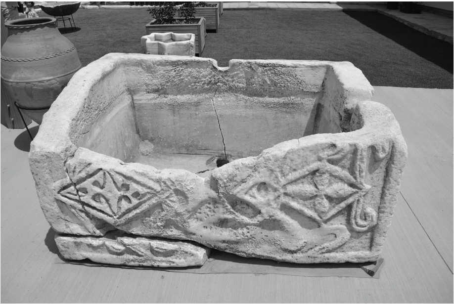
Fig. 4 Ödemiş Müzesi'ndeki lahit teknesinin arka yüzü