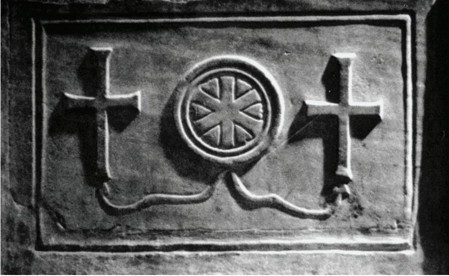
Fig. 6 Poreč, Eufrasius Kilisesi'ndeki Başkent şemalı levha (Terry 1988, fig. 62)