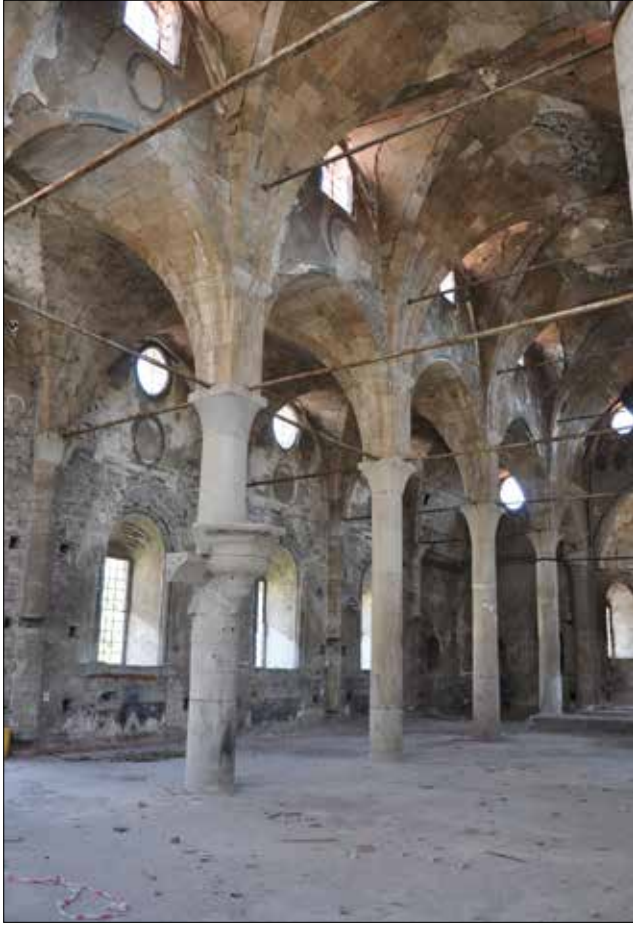
Fotoğraf 6: Isparta, Aya İshotya (Yorgi) Kilisesi, naos kuzey duvarı. / Isparta, Aya İshotya (Yorgi) Church, the north wall of naos.