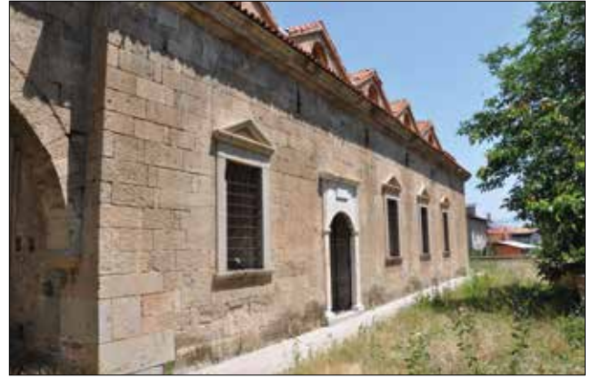
Fotoğraf 3: Isparta, Aya İshotya (Yorgi) Kilisesi, güney cephe. / Isparta, Aya Ishotya (Yorgi) Church, south facade.

Isparta, Doğanca mahallesindeki Aya İshotya (Yorgi) Kilisesi mübadele sonrası askeri depo olarak kullanılmış, daha sonra âtil hale gelmiştir. 1975 yılında tescil edilen kilise, bir çevre duvarı içinde yer alır (Kılıç 2009: 181; Foto. 1-2). Kilisenin 1857-1860 yılları arasında yapıldığını gösteren yazıtı bugün Isparta Müzesi'ndedir. Farklı iki boyut ve kalınlıkta kesme taşlarla yapılmış, duvarların kesiştiği köşeler ise büyük düzgün kesme taştandır. İç mekânda ve nartheks doğu duvarında ise farklı boyut ve kalınlıktaki taşların arasına kiremit kırıkları yerleştirilmiştir. Nartheks doğu duvarı sıvalıdır.