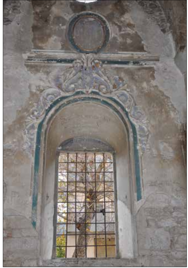
Fotoğraf 7: Isparta, Aya İshotya (Yorgi) Kilisesi, naos güney duvarı penceresi. / Isparta, Aya İshotya (Yorgi) Church, the window of southern wall of naos.

Orta nef tonozu ile nefleri ayıran sütunların kemerleri arasında yer alan üst sıra kemer alınlıklarında sivri yayvan kemerli pencerelerin hemen altında alçı profil ve şeritten yapılmış yuvarlak formda birer madalyon bulunmaktadır. Alçı kaplama orta nef tonozunun apsisin hemen önünde yer alan doğu yöndeki çapraz tonozunda bir bölümü günümüze ulaşmış iki madalyon vardır. Bunlar alçı profil ve şeritlerden yapılmış kıvrık dal ve yapraklarla çerçevelenmiş, ana ekseninde palmet ve iki yanında taç benzeri yapraklara yer verilmiştir.