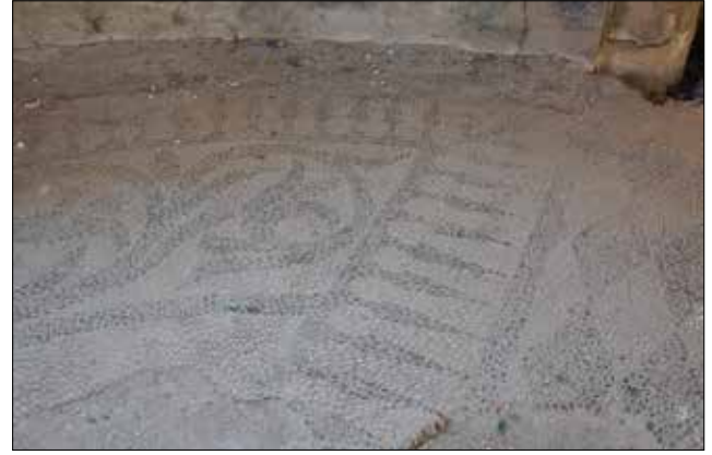
Fotoğraf 5: Isparta, Aya İshotya (Yorgi) Kilisesi, bema mozaïği. / Isparta, Aya Ishotya (Yorgi) Church, bema mosaic.

sahiptir. Apsis kavsini aynı formda dolaşan bordür içinde ise selvi ağaçlarından oluşan bir süsleme yer alır. İki bölüme ayrılmış apsis kavsini içinde ise beyaz zemin üzerinde siyah taşlarla "S" şeklinde düzenlenmiş kıvrık dallar, palmet ve lotuslardan oluşan bitkisel bezemeye yer verilmiştir (Foto. 5).