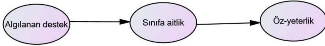
Şekil 1. Değişkenler arasındaki ilişkiyi gösteren model