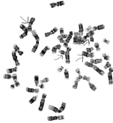
Resim 2: Olguya ait metafaz

okul çağı döneminde konuşma geriliği, belirgin zihinsel retardasyon olmamakla birlikte öğrenme güçlüğü ve davranışsal/sosyal problemler olabilir.