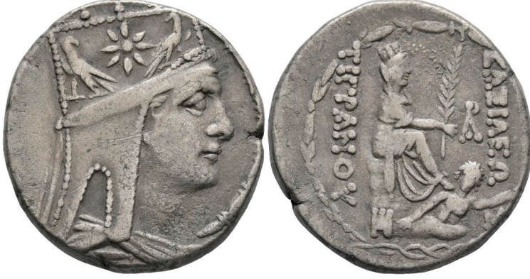
Figür 1. II. Tigranes (Gümüş tetradrachme sikkesi, MÖ ca. 80-68. Sağa doğru II. Tigranes. Başlık giymekte ve iki kartal arasında kuyruklu yıldızla dekore edilmiş beş-uçlu iara giymekte. Tersi. ΒΑΣΙΛΕΩΣ-ΤΙΓΡΑΝΟΥ. Taretili ve örtülü Tykhe sağda kaya üzerinde oturmakta, sağ elinin önünde uzun bir palmye ağaç dalı tutmakta; altında nehir-tanrısı Arakses yüzmekte). https://www.coinarchives.com/a/results.php?search=Tigranes+II