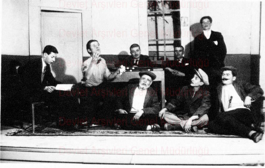
Fon No: 490 1 0 0 - Kutu No: 1070 - Dosya No: 1100 - Sıra No: 1