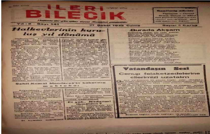
27 Şubat 1948 Tarihli İleri Bilecik Gazetesinde Bilecik Halkevi ile ilgili Haber. EK 7.