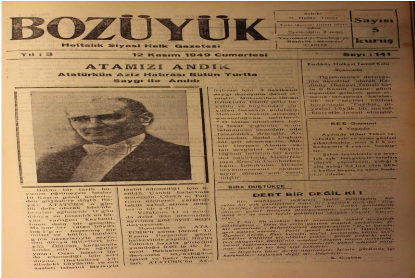
Bilecik Halkevi ile ilgili İleri Bozüyük Gazetesinin 28 Aralık 1951 Tarihli Haberi.