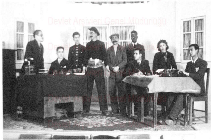
Fon No: 490 1 0 0 - Kutu No: 1070 - Dosya No: 1100 - Sıra No: 1