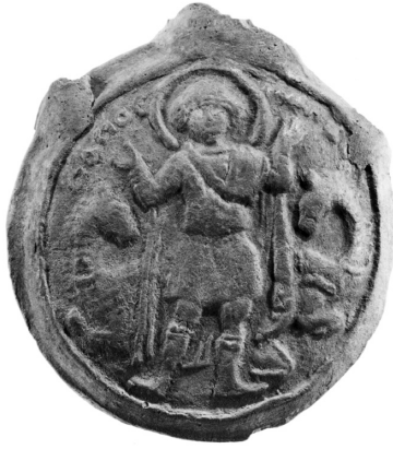
Res. 1 Menas Ampullası'ndaki Aziz Menas tasviri