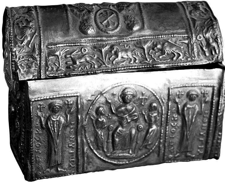
Res. 6 Adana Müzesi, Çırğa Rölikeri'ndeki Aziz Konon tasviri