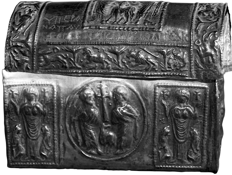
Res. 5 Adana Müzesi, Çırğa Rölikeri'ndeki Azize Thekla tasviri