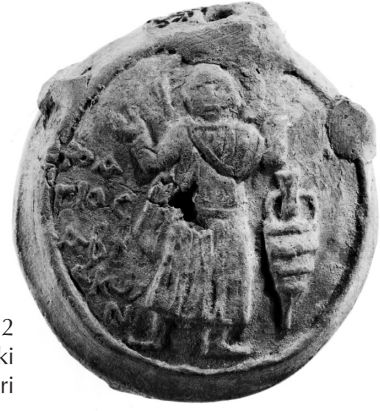
Res. 2 Menas Ampullası'ndaki Aziz Konon tasviri