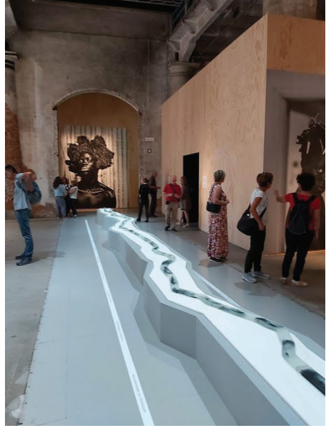
Görsel 7: 58. Venedik Bienali, 2019, Arsenale. Küratör: Ralph Rugoff.

Küratörler kendi düzenledikleri bienal deneyimleri üzerine farklı saptamalarda bulunmuşlardır. Örneğin, küratör Rugoff 37 bienali izleyici açısından irdelemiş ve genel olarak bienallerin belli yapıtlar karşısında birey olarak izleyicinin deneyimi ile daha az ilgilenmekte olduğunu, onun yerine daha küresel bir profil inşa etme çabası taşıdığını