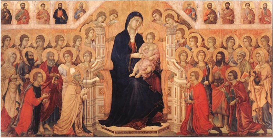
Görsel 10: Duccio di Buoninsegna, Maestà, 1308–1311.

Beatrice von Bismarck, küratörün otoritesi meselesini, tarihten farklı örneklerle benzetme kurduğu resimler ve bir fotoğrafla pekiştirmektedir. Görsel 10’ da Duccio’nun “Maesta” adlı eserinde kompozisyon bir tapınma ve derin bir hürmet üzerine kuruludur. Merkezde Meryem ve kucagında tanrılaştırılmış bebek İsa bulunmaktadır. Tanrı’nın annesi, çocuğu Mesih İsa’yı, çevresini saran ölümlülerden uzak bir noktada tutmaktadır. Kadın kafası hafif eğilmiş, bakışlarını izleyiciden uzak tutarken, tanrılaşmış İsa, resmin dışındaki dünyaya otoriter bir şekilde bakmaktadır. Öyle ki, izleyici bile kendisini onlara tapınan merkezin dışındaki ölümlülerin arasına yerleştirmektedir. Benzer şekilde, Ingres’ın “The Apotheosis of Homer” (Görsel 11) adlı resminde de merkezde Homer, otoriter bir figür olarak yer almaktadır. Bu eserde, kutsal güçler tarafından şaire bahşedilen beceri ustalıklı görselleştirilmiştir. Dönemin cinsiyetçi yaklaşımına da gönderme yapan resimde merkezi perspektifin öznesini erkek karakter oluşturmakta, öte yandan dışı musalar şairin ayaklarının dibinde oturmaktadır. Resmin dışına taşan kompozisyonda, ön plandaki figürler merkezdeki figüre odaklanmış, böylece tüm dikkatin şair üzerine odaklanması sağlanmış, izleyici tanık durumunda bırakılmıştır. Resmi izleyen de, şairi çevreleyen merkeze yakın ancak, gücü temsil eden figürün çok daha altında konumlandırılmıştır. 44