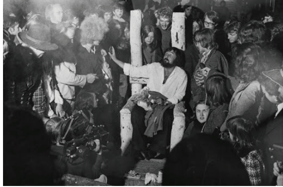
Görsel 12: Balthasar Burkhard, isimsiz, fotoğraf, (Harald Szeemann, documenta 5, son gün), Kassel 1972.

[ https://www.louvre.fr/en/oeuvre-notices/homer-deified-also-known-apotheosis-homer ]