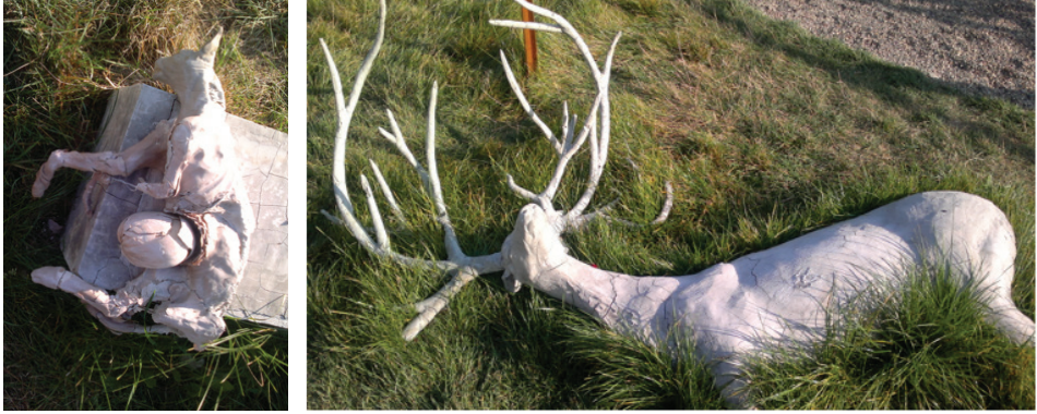
Görsel 8: Adrián Villar Rojas, “Return the World”, 2012, Weinbergterrassen, dOCUMENTA 13, Küratör: Carolyn Christov-Bakargiev.

ifade etmiştir. Lee’ye 38 göre ise bugün bienaller, bir yandan kendi yerelliklerinin altını çizirken, kültürel aktarımın buluşma noktası için alan yaratmaktadır. Öyle ki burada özne ve nesne yerleşik statüsünü kaybetmiş, batılı ve batılı olmayan arasındaki hiyerarşi de kaybolmuştur. Hans Ulrich Obrist 39 bir küratör olarak, bienallerin belli kalıplar içinde sıkışıp kaldığı konusunda yakınmaktadır. Obrist’e 40 göre, bienaller, belli sayıdaki sanatçı ve onlara ayrılan belli alanlarla, sanki ilk defa yapılmış gibi kendini tekrar eden yine belli formlar içindeki sergilerdir. Bu anlamda Obrist, tekrara düşmenin altını çizmiş ve “bence rutinleşme bir serginin en büyük düşmanıdır” demiştir.