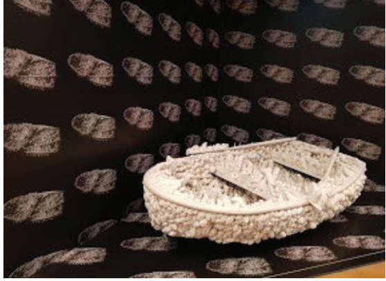
Görsel 5: Yayoi Kusama, “Aggregation: One Thousand Boats Show, 1963, Stedelijk Müzesi, Amsterdam, küratör: Henk Peeters.

Bağımsız küratörlük anlayışı sergilere ve koleksiyonlara yeni bir soluk ve yeni bir perspektif kazandırmıştır. Bu bağlamda, kurumsal küratörlerine sıkı sıkıya bağlı kurumlar bile, bağımsız küratörün koleksiyonlarına getireceği taze atmosfere ihtiyaç duymaktadır. Bunun en çarpıcı örneklerinden birini Amsterdam’daki Stedelijk Müzesi oluşturmaktadır. Müze, 8 Haziran 2020’de, kendi bünyesine iki yeni bağımsız küratör atadığını sayfasından duyurmuştur. Bu küratörlerden biri, 10. Berlin Bienali’nin küratöryal takımında yer almış, aynı zamanda Weltkulturen Müzesi’nin de eş küratörlerinden biri olan Yvette Mutumba; diğeri ise documenta 14 küratörlüğünü ve Kunsthalle Basel’in direktörlüğünü yapmış olan Adam Szymczyk’dır. Aslında bu duyuru aynı zamanda bir itiraf niteliğindedir. Stedelijk, değişik fikirleri ile sergi programına ve koleksiyonuna alternatif bir bakış açısı ve kuruma yeni bir enerji kazandıracak küratörlere duyduğu ihtiyacı bu şekilde bir bakıma dile getirmiştir. Müze, küratörlerinden gelecekteki sergileri oluşturmalarını ve koleksiyonların sunumunu yapmalarını; bu sergiler için kendi kavramlarını, yayımlarını ve izleyici programlarını oluşturmalarını beklemektedir. 34 Bu hedefler için seçilen her iki küratör de bienal küratörü olarak karşımıza çıkmakla birlikte farklı pratiklere de imza atmışlardır.