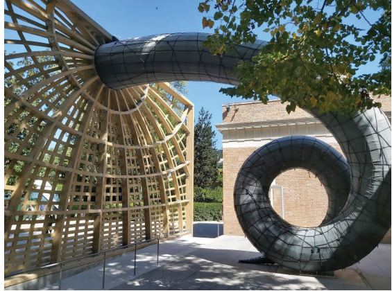
Görsel 9: Martin Puryear, “Swallowed Sun”, 2019, 58. Venedik Bienali, Amerikan Pavilyonu, Giardini, Küratör: Brooke Kamin Rapaport.

ifade etmiştir. Lee’ye 38 göre ise bugün bienaller, bir yandan kendi yerelliklerinin altını çizirken, kültürel aktarımın buluşma noktası için alan yaratmaktadır. Öyle ki burada özne ve nesne yerleşik statüsünü kaybetmiş, batılı ve batılı olmayan arasındaki hiyerarşi de kaybolmuştur. Hans Ulrich Obrist 39 bir küratör olarak, bienallerin belli kalıplar içinde sıkışıp kaldığı konusunda yakınmaktadır. Obrist’e 40 göre, bienaller, belli sayıdaki sanatçı ve onlara ayrılan belli alanlarla, sanki ilk defa yapılmış gibi kendini tekrar eden yine belli formlar içindeki sergilerdir. Bu anlamda Obrist, tekrara düşmenin altını çizmiş ve “bence rutinleşme bir serginin en büyük düşmanıdır” demiştir.