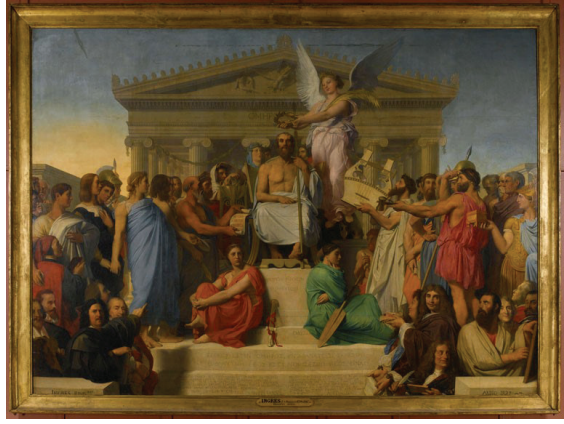
Görsel 11: Jean-Auguste Dominique Ingres, The Apotheosis of Homer, 1827.

olan küratörün üzerine yoğunlaşmıştır. Karşılaştığımız diğer resimlerden farklı olarak, burada izleyicinin konumu düzey olarak en alttır. Öyle ki izleyici, “Maesta” da olduğu gibi ölümlülerden biri ya da “The Apotheosis of Homer” deki gibi iktidara yakın bir şekilde konumlandırılmamıştır. Direktiflerini veren ya da son sözü söyleyen küratör merkezde, onu çevreleyen sanatçılar ondan daha alt düzeyde, izleyici ise sanatçılardan da daha alt düzeyde, yani senaryonun tamamen dışında, ama bu güce tanıklık eden olarak yerini almıştır. 45 Fransız İhtilali’nden bu yana, devleti, ulusu, burjuvaziyi ideolojik olarak temsil eden, yeni anlamlar çerçevesinde farklı bağlamlar geliştirebilen sergiler düzenlense de, sergiyi organize eden tek bir küratör üzerine geliştirilen odak son derece yenidir. Dolayısıyla, Szeemann’ın fotoğrafı küratörün söylemi açısından bir dönüm noktasına işaret etmektedir. Çünkü, burada da görselleştirildiği gibi küratör bir “meta-sanatçı” (“sanatçı ötesi”) olmuştur. İşte, küratör ve sanatçı arasındaki çekişmenin merkezini de “meta-sanatçı” kavramı oluşturmaktadır. 46 Szeemann’ı merkeze alan bu fotoğraf, docu-