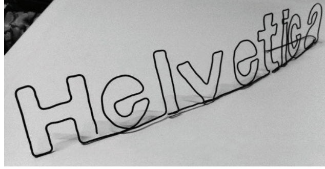
Görsel 5. Telden oluşturulan Helvetica yazıyüzü formu.

Entropinin Helvetica üzerindeki parçalanma, bozulma veya dağılma sürecini örneklendirip görselleştirmek için, iki deneysel tipografi çalışması yapılmıştır. Ayrıca bu sürecin sonunda yeniden dengeye ulaşan yazıyüzü formlarıyla birkaç örnek çalışma hazırlanmıştır. İlk olarak metal bir teli şekillendirerek Helvetica formu oluşturulmuştur (Görsel 5).