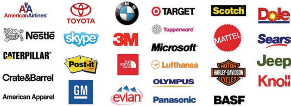
Görsel 3. Helvetica yazıyüzü kullanan bazı büyük şirketler.

Helvetica üretiminden bu yana neredeyse en çok kullanılan yazıyüzüdür. Birçok önemli küresel marka ve şirket bu yazıyüzü ile yaratılmıştır (Bigman, 2016). Hayatımızda Helvetica’sız bir gün neredeyse geçmemektedir (Görsel 3). Kendisi de bir yazıyüzü tasarımcısı olan New York’lu Cyrus Highsmith, Helvetica’sız bir gün geçirmeye çalışır ve bu yazıyüzünün olduğu şeyleri kullanmaz. Fakat karşılaştığı durum hiç de kolay değildir: Her gün giydiği kıyafetleri giyemez, metroya binemez, New York Times okuyamaz, dolar kullanamaz vb. şekilde liste uzayıp gitmiştir (Ahmet Kurt, 2015). Gerçekten Helvetica ile bu kadar karşılaşıyor olmamız yazıyüzünün mükemmel bir tasarım içerdiğine mi işaret ediyor? Yoksa tasarımda tembelliğe, kolaya kaçışın bir göstergesi midir?