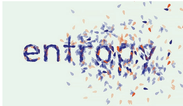
Görsel 1. Entropi için yapılmış bir tipografi çalışması.