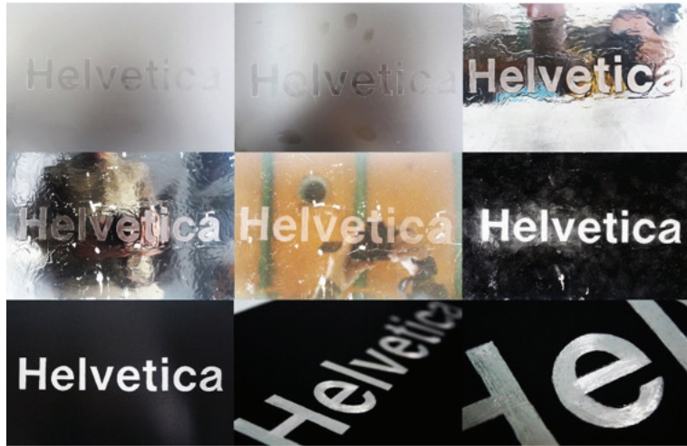
Görsel 8. Metal plaka üzerindeki Helvetica yazısının zamanla değişimi.

Pürüzsüz ve temiz olan Helvetica metal plakası zamanla doğal ve çoğunlukla yapay müdahalelerle deformasyon sürecine tabi tutularak bu bozulma örnekendirilmiştir. Bu bozulma sürecinde yüzey birçok farklı aşamadan geçirilmiştir. Dışarıda bırakılmış, kendi başına kazalara uğramış, lak ile temas ettirilmiş, aside indirilmiş, oyulmuş ve son olarak çizilmiştir (Görsel 8). Ayrıca Helvetica metal plakası bu süreçte kimi zamanda düzeltilmiştir.