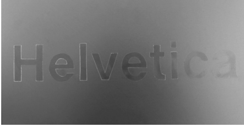
Görsel 7. Metal plaka üzerine yazılan pürüzsüz Helvetica yazısı.

Bir süre sonra oluşan istemsiz kıvrımların giderilmesi için, tekrar tekrar ele alınan form daha çabuk deformasyona uğramaya başlamıştır. Telin yapısı gereği, telin aynı yerinin hareket ettirilmesi onun o bölgesini daha da hassas hale getirmiştir. Helvetica'ya yapılan müdahaleler bazen istemeyerek dahi olsa onu daha kırılğan yaparak, aleyhine sonuçlar doğurmuştur. 60 yıllık Helvetica'nın tarihine bakıldığı zaman sonradan elde ettiği olumsuz anlamlardan kurtulma, tarafsız olduğu anlayışı ve daha fazla kişiye ulaşma isteği onu daha da popülerleştirerek yeni tehditlere açık hale getirmiştir. İkinci örnek ise pürüzsüz bir metal plaka üzerine Helvetica yazılmasıdır (Görsel 7).