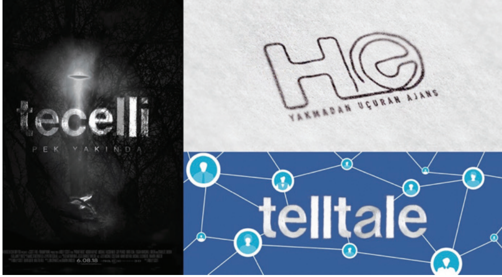
Görsel 10. Değişim sonrası yazıyüzü için örnek çalışmalar. Sol: Tecelli filmi için afiş tasarımı. Sağ üst: Bir sosyal medya ajansı için logo tasarımı. Sağ alt: Facebook kapak görüntüsü tasarımı.